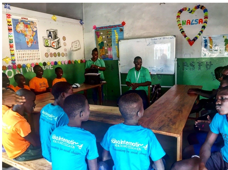
Ci dessus, la salle de cours à Djena pour les enfants

Au cours de cette journée j'ai aidé les membres de l'unité éducation à préparer des feuilles de calculs pour les enfants, des jeux, et des chansons. J'ai également apporté mon soutien et ma bienveillance aux enfants lorsqu'ils étaient en train de travailler.