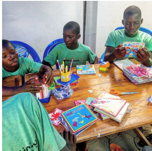
Atelier origami organisé pour les enfants venus témoigner au cours de l'exposition

Exposition de photos représentant des situations réelles des enfants des rues (par exemple une photo où un enfant dort sur la plage, une autre où un enfant cherche à manger dans une décharge pour ordures...). L'exposition a pour but de sensibiliser la population locale aux conditions de vie de ces enfants et de promouvoir l'association.