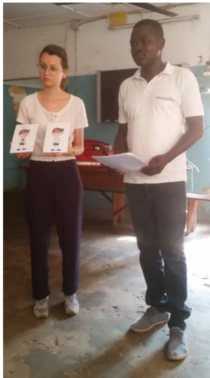
Sensibilisation aux règles hygiéno-diététiques à la brigade pour mineurs

Activités et support : diffusion du film « comment faire une lessive » ; évaluer les connaissances de l'enfant à l'aide d'un questionnaire