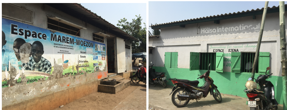
Ci-dessus, des locaux dans lesquels sont accueillis les enfants

Le lundi étant consacré aux réunions et aux activités de bureau (présentation du travail réalisé au cours de la semaine : les problématiques et les solutions apportées ; partage et sauvegarde des informations relatives aux enfants dans une base de données), je me suis rendue tous les mardis, jeudi et vendredi aux différents centres (consultations à Adoboukome, à Agoe, à Djena) et orphelinats (Marem et Mercy Childrens Home). Au sein d'une journée, une visite est effectuée le matin de 9h à 12h et une seconde l'après-midi de 14h à 17h.